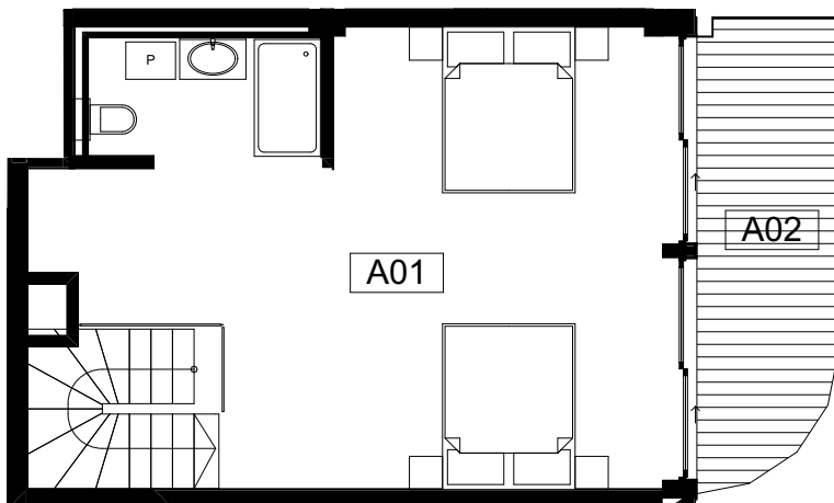
POZIOM II ( 37,82 m 2 )