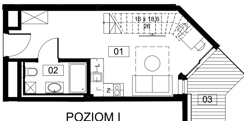
POZIOM I (29,34 m 2 )